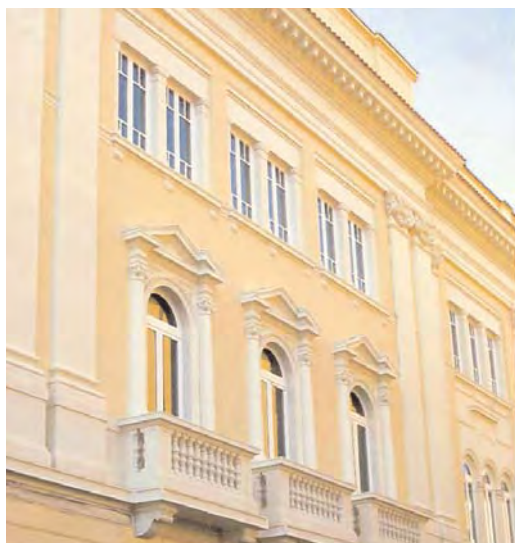
Livorno 13 aprile 1923. Reverendissimo padre, la reliquia del Braccio di S. Francesco Saverio, portata per tre giorni a Livorno, è partita per Ravenna.