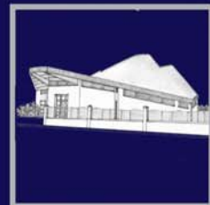
San Giustino de Jacobis